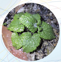
元気なハーブティー フレッシュレモンバーム：10枚 ドライペパーミント：ティースプーン1

あと忘れてはいけないのは、春の野菜やハーブにはミネラルが豊富に含まれてはいますが、たんばく質や脂質、ヒタミン類が正常に体内で働く為には欠かせない栄養素です。体内機能が正常に働く事が、もっとも美しく健康的なことだと私は思っています。さてさて話が脱教じみてきたので、我が家の最近のハーブ状況に切り替えましょう。厳冬を乗り切り、何とか芽吹いてきました。うれし〜!